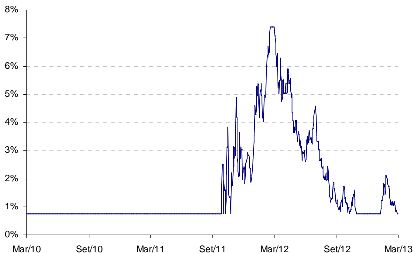
Tabela síntese correspondente à percentagem de observações em que, para Depósitos constituídos entre o dia 12 de Março de 2007 e o dia 12 de Março de 2010 (última data de constituição possível para produto a 3 anos e que portanto terminaria a 12 de Março de 2013), a TANB teria sido: