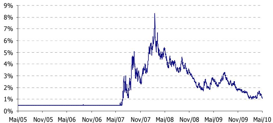
Comportamento da TANB do produto com base em dados históricos