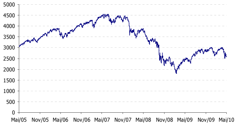
Evolução histórica do índice

Nota: gráfico elaborado pelo Banco Santander Totta, S.A., com base em dados obtidos da Bloomberg