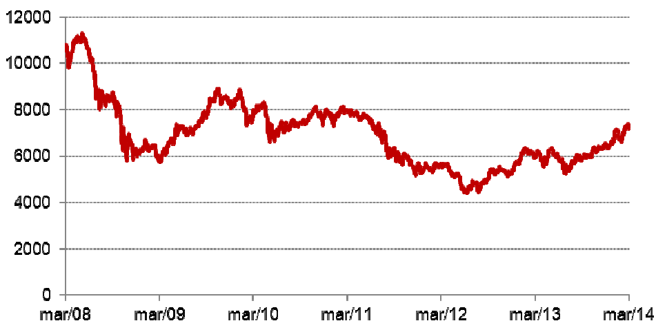
Evolução histórica do Índice de Ações

Nota: gráfico elaborado pelo Banco Santander Totta, S.A., com base nos valores de fecho ajustados obtidos da Bloomberg.