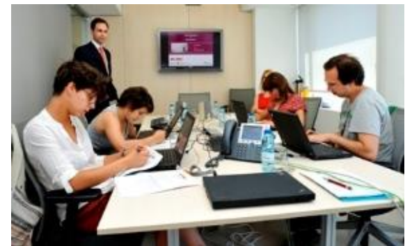
Fruta Feia – Vencedora do Prémio António Sérgio 2014