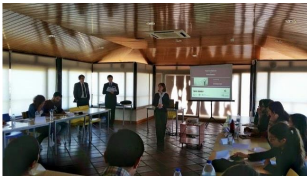
Academia ES Jovem – Almada