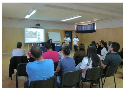
Ação de formação financeira na Escola Profissional Vértice (Paços de Ferreira)