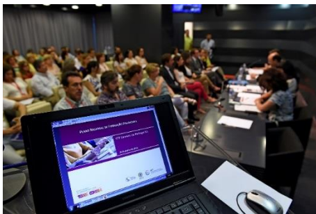
Conferência “Finanças responsáveis” nos CTT – Correios de Portugal (Lisboa)