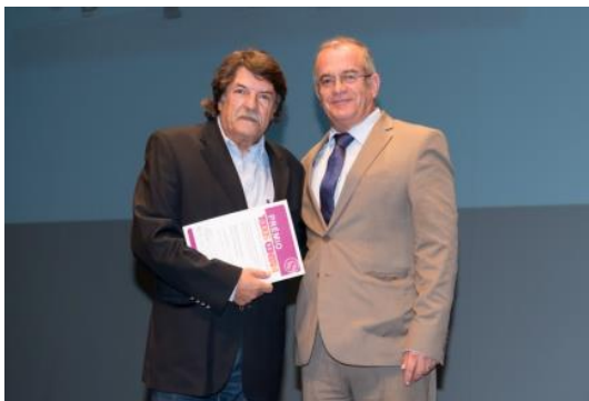
Agrupamento de Escolas de Marco de Canaveses (Porto)