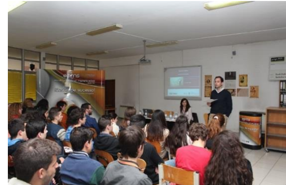
Escola Profissional Mariana Seixas – Vencedora do Prémio António Sérgio 2014