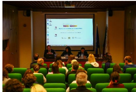
Ação de formação financeira aberta ao público em geral (Lisboa)