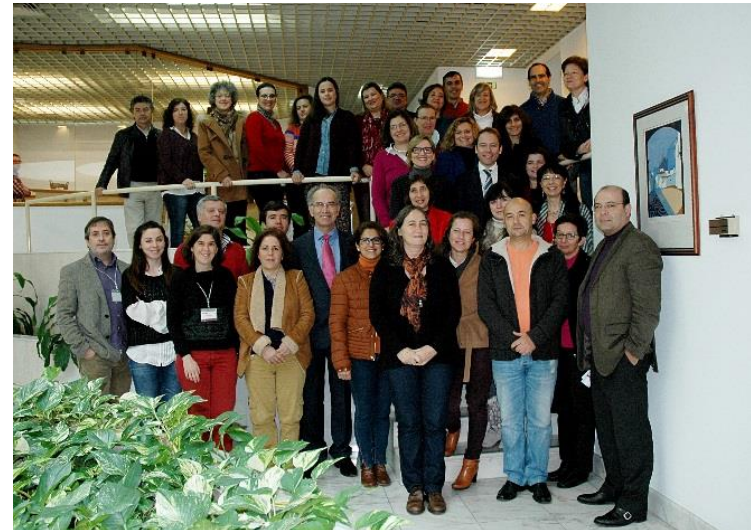
2.º semestre de 2015 – Évora