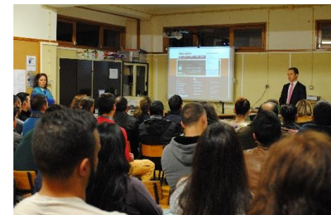
Ação de formação financeira no Agrupamento de Escolas de Vendas Novas