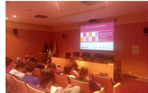
Ação de formação financeira na Escola Profissional de Viticultura e Enologia da Bairrada (Anadia)