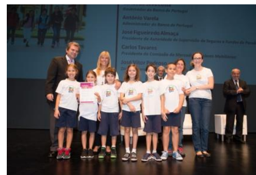
Colégio Oficina Divertida (Faro)