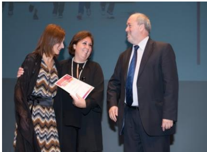
Jardim-Escola João de Deus (Leiria) - Prémio da educação pré-escolar