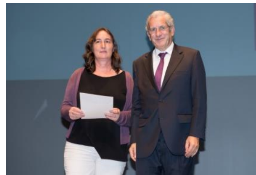
EB 2,3 de Santa Iria de Azóia, do Agrupamento de Escolas de Santa Iria de Azóia (Lisboa)