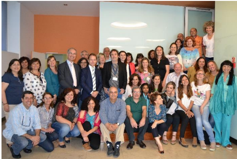
1.º semestre de 2015 – Lisboa