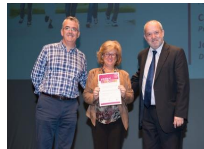
Agrupamento de Escolas Tomás Cabreira (Faro) - Prémio especial do júri