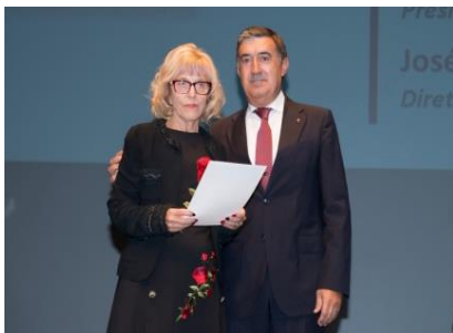
Didáxis - Riba de Ave - Prémio do 3.º ciclo do ensino básico