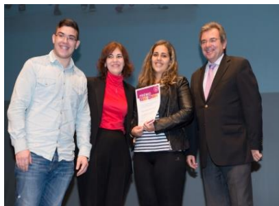
Escola Secundária da Ribeira Grande (Açores) - Prémio do ensino secundário