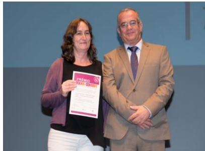
Escola Básica do 1.º CEB Conde Castelo Melhor, do Agrupamento de Escolas de Pombal - Prémio do 1.º ciclo do ensino básico