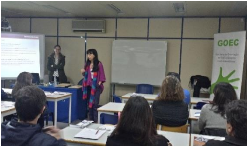
Ação de formação financeira na ANEME (Marinha Grande)