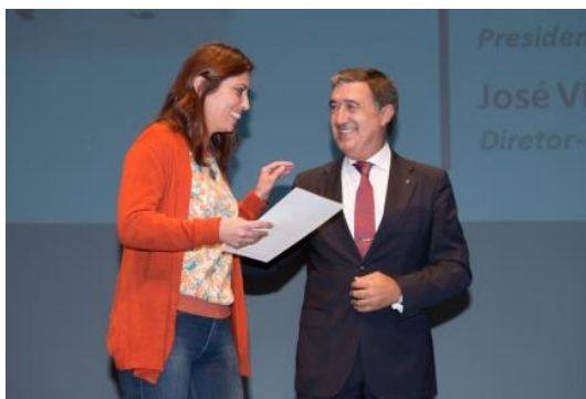
Centro de Bem Estar Social de Foros de Salvaterra (Santarém)