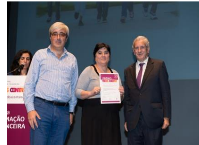
Centro Educativo dos Olivais, do Agrupamento de Escolas Martim de Freitas - Prémio do 2.º ciclo do ensino básico