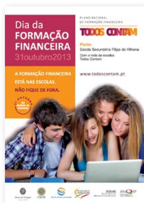
Cartaz do Dia da Formação Financeira 2013.