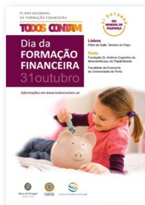
Cartaz do Dia da Formação Financeira 2012.