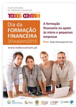
Cartaz do Dia da Formação Financeira 2015.