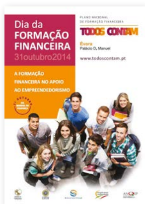
Cartaz do Dia da Formação Financeira 2014.