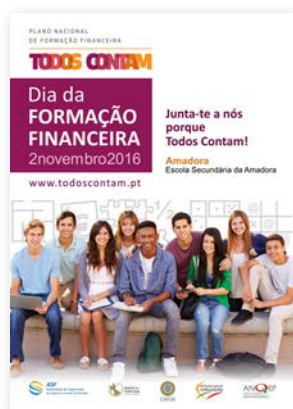
Cartaz do Dia da Formação Financeira 2016.

Também o Sindicato dos Jogadores Profissionais de Futebol (SJPF) juntar-se-á ao Plano nesta iniciativa, promovendo a “Jornada da Formação Financeira” de 24 a 31 de Outubro, que visa sensibilizar a importância da formação financeira, através de jogos, workshops e formação nas escolas.